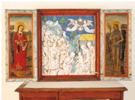
Epifania. Andrea della Robbia i taller, c. 1475.

Cada Nadal, des de mitjan desembre fins al 2 de febrer, el monestir exposa un pessebre popular elaborat per l'Associació de Pessebristes de Barcelona. D'aquesta manera, es conserva una tradició que les religioses han preservat al llarg del temps i que gaudeix d'un arrelament popular important. L'origen del costum de representar el naixement de Jesús s'atribueix a Sant Francesc d'Assís, fundador de l'ordre franciscà, que el Nadal del 1223, va representar un pessebre vivent al bosc de Greccio (Úmbria). Posteriorment, franciscans i dominics van escampar arreu el costum del pessebre. A Catalunya, trobem els primers pessebres en entorns eclesiàstics a partir del segle XIV, i en àmbits domèstics a partir del segle XVI.